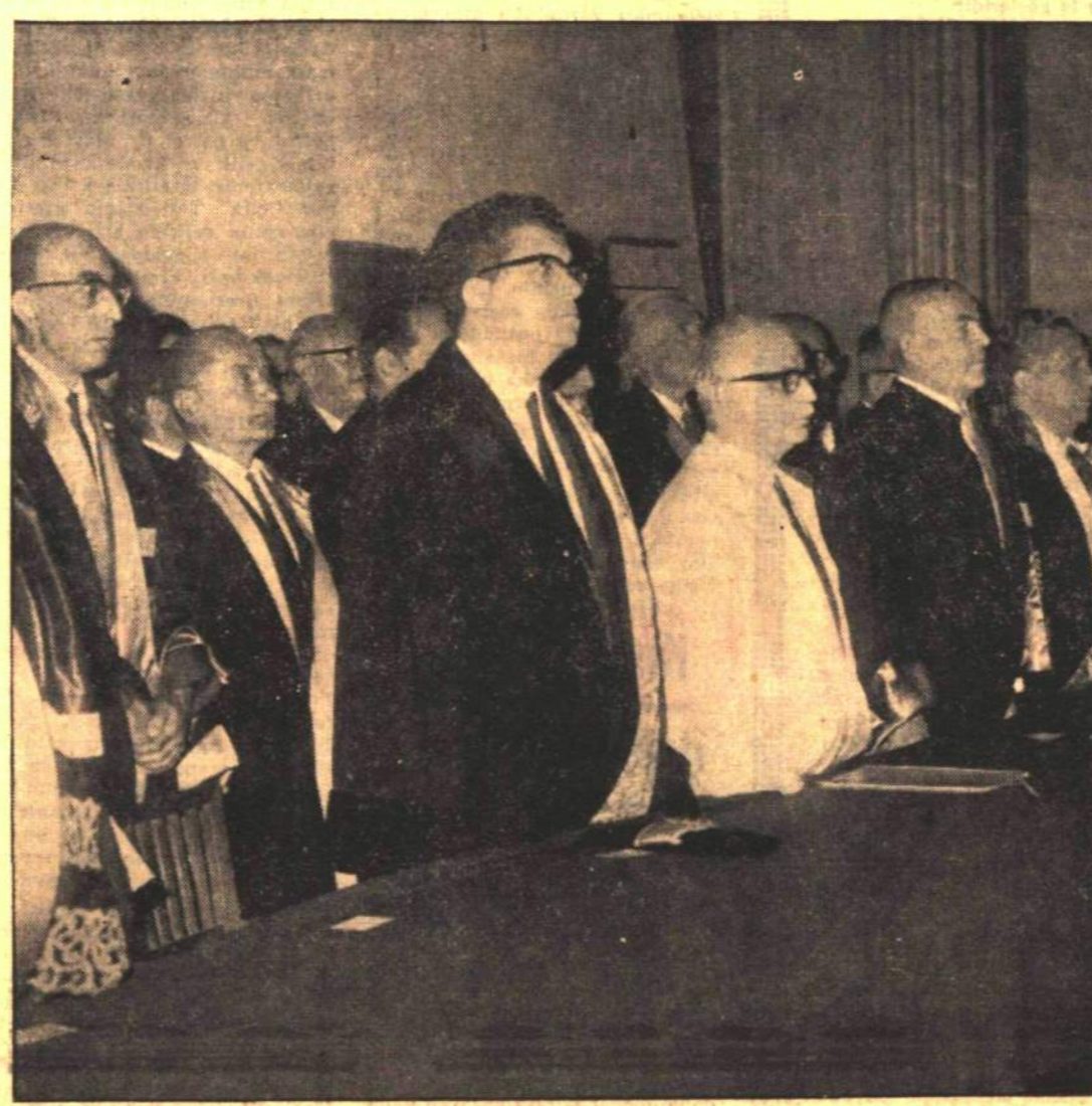
İSTANBUL ÜNİVERSİTESİNİN AÇILIŞ TÖRENİNDEN BİR GÖRÜNÜŞ

Valderreman'ın kalbini takviye eden âlet, 1964 öğütusunda yerleştirilmişti ve pillerin 5 yıl çalışması bekleniyordu.