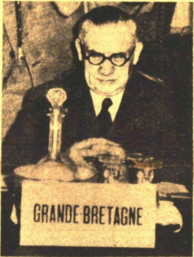
Bevin; dağılan konferans masasında bütün Avrupa devletlerini konferansa davet kararı Fransız ve İngiliz hükümetleri tarafından müştereken alınmıştır.

Bu toplantıya iştirak etmek isteyen — Arkası Sa. 3, Sü. 2 de —